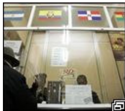
La asociación rumiñahui